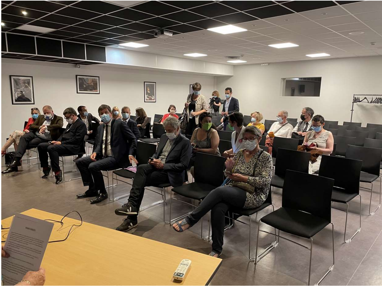
Inauguration du Forum des Consommateurs