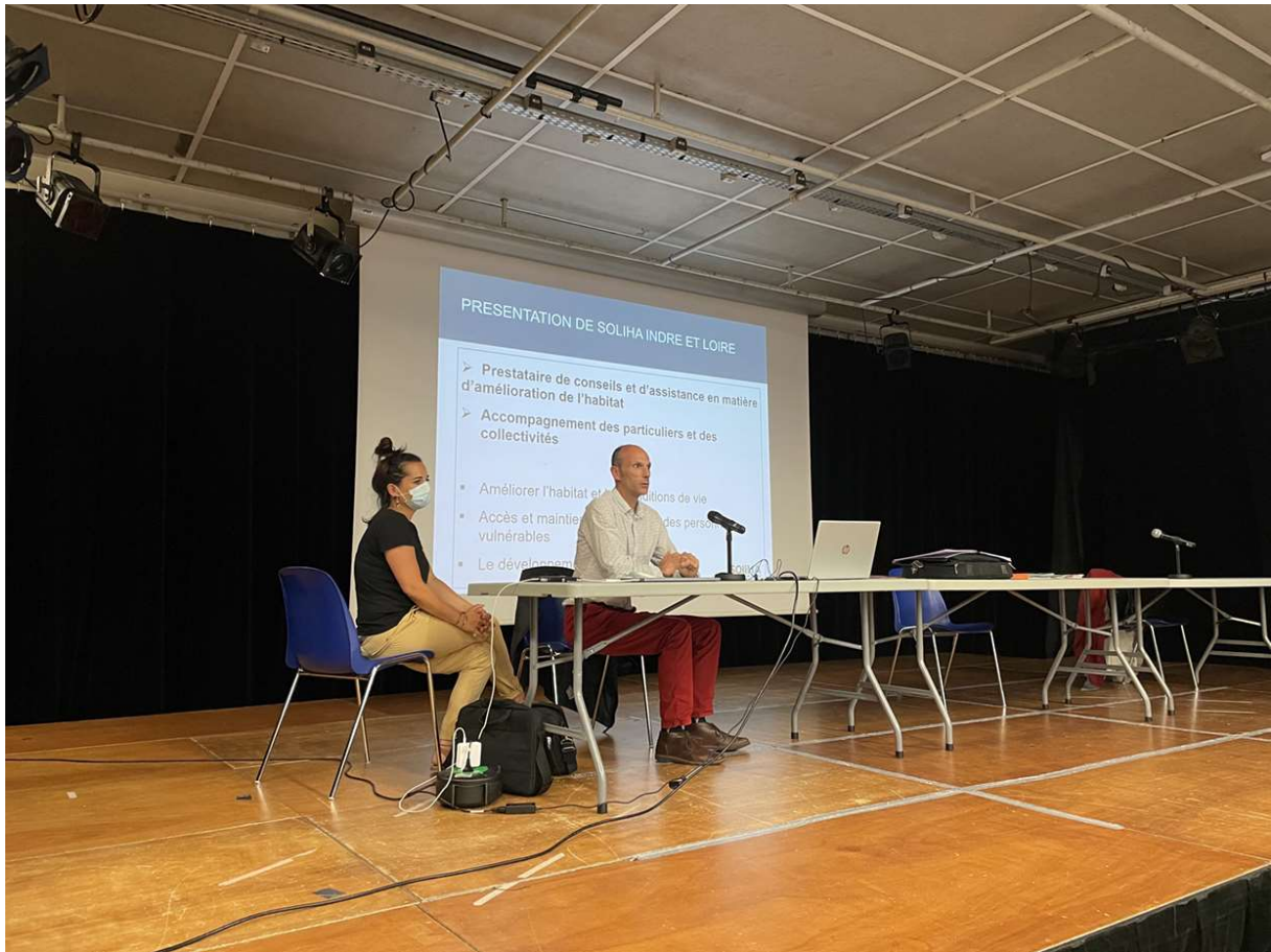
Présentation de SOLIHA à la fin de l'AG de la CLCV Touraine