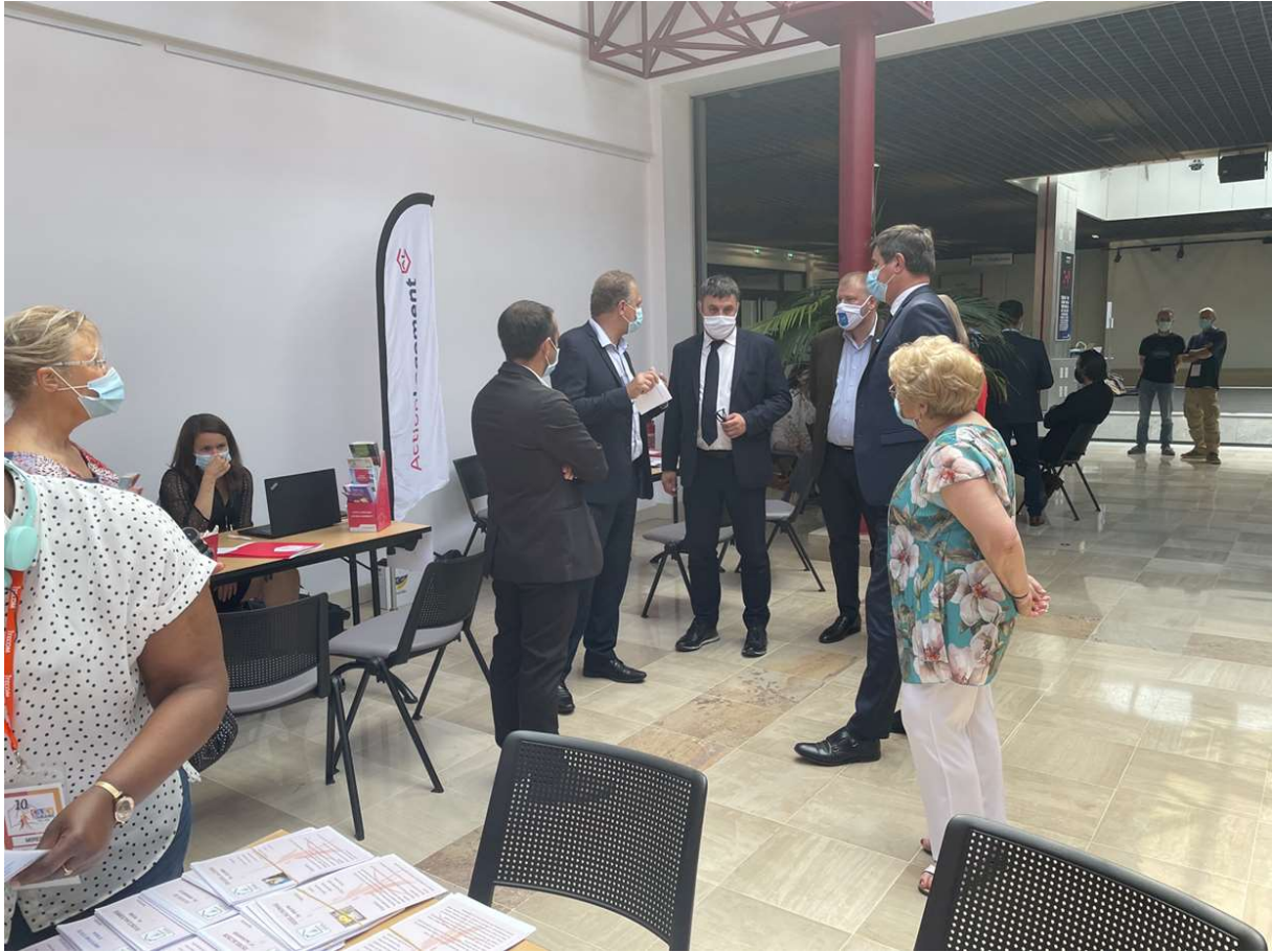
Inauguration du Forum des Consommateurs